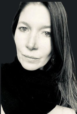
@Ideomágica Escritora - Poeta Artísta Visual

Desastres humanos desordenes psíquicos hoy dejan a la civilización hundida en su propio humo.