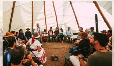
VISIÓN DE ABUELO Encuentro - Noviembre La Reina - Chile Organiza Fundación Conciencia Ancestral

DISTRIBUCIÓN GRATUITA JUNIO - 2025 - SANTIAGO - CHILE